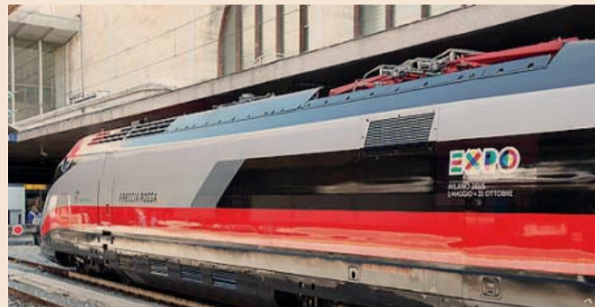
Vettore ufficiale dell'Expo. Il Frecciarossa con il logo dell'Expo 2015