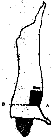
Figura 1: Aree di campionamento per il test di E. coli e Salmonella spp. su carcassa di suino

Linee guida per la ricerca di E. coli e Salmonella da carcasse di suino.