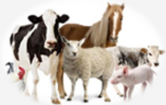
Mangimi per animali DPA (animali da pelliccia)