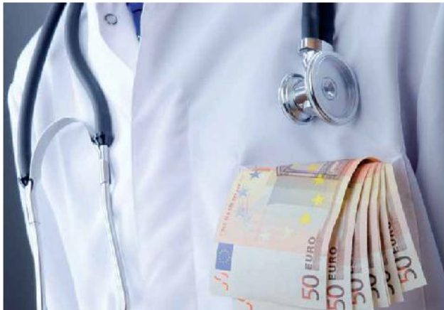
Foto: Italian SpA - Spedite in Abbonamento Periodico 70% - L. 4/88

Anno 4 - N° 11 - Dicembre 2011 IL MENSILE DEL MEDICO VETERINARIO